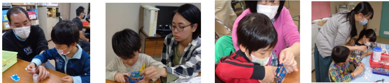
低学年の組み立てには保護者の方のご協力もいただきました。感謝です。