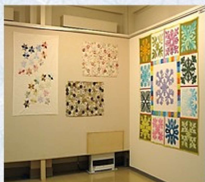
花を添えるパッチワーク