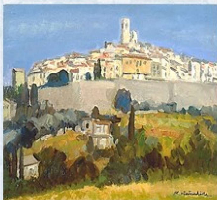
サンポールの古い城