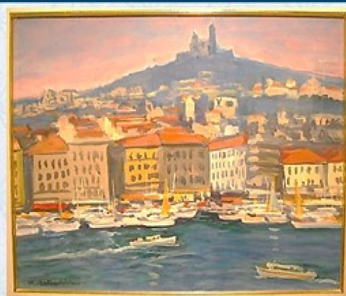
マルセイユ・バジリカ聖堂