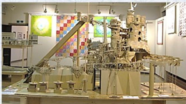
難攻不落の藤森城