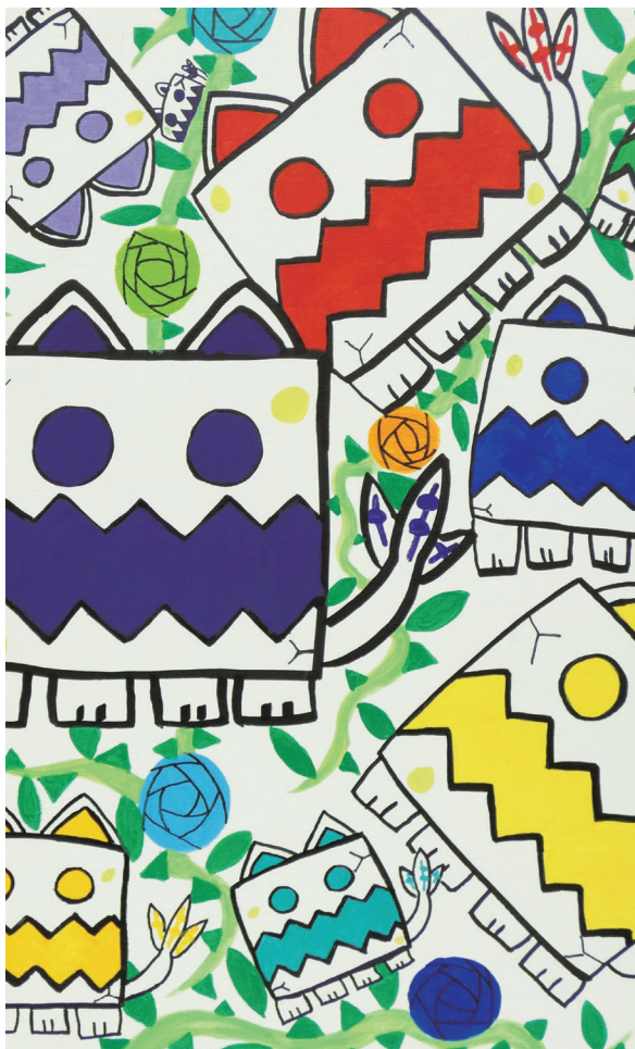
HIROTO 《カールカラーズ》(部分)