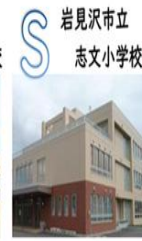
岩見沢市立 志文小学校