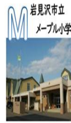
岩見沢市立 メイプル小学校