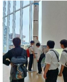
津波の高さを確認

○東日本大震災の復興がまだ途中の段階であることや、北海道の歴史や文化との違いを見聞き、級友と過ごした2泊3日はたくさんの思い出ができたこととします。