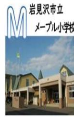
岩見沢市立 メープル小学校