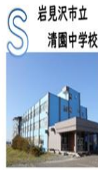
岩見沢市立 清園中学校