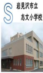
岩見沢市立 志文小学校