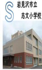
岩見沢市立 志文小学校