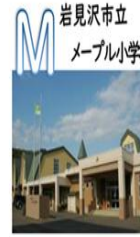
岩見沢市立 メイプル小学校