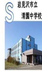
岩見沢市立 清園中学校