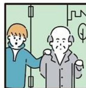
目の難せない家族の見守りや声かけなどの気づかいをしている。