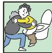
障がいや病気のある家族の入浴やトイレの介助をしている。