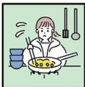
障がいや病気のある家族に代わり、買い物・料理・掃除・洗濯などの家事をしている。