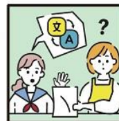
日本語が第一言語でない家族や障がいのある家族のために通訳をしている。