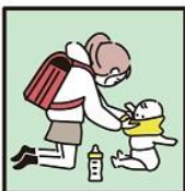
家族に代わり、幼いきょうだいの世話をしている。