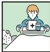
がん・難病・精神疾患など慢性的な病気の家族の看病をしている。