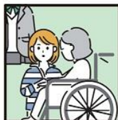
障がいや病気のあるきょうだいの世話や見守りをしている。