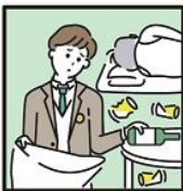
アルコール・薬物・ギャンブル問題を抱える家族に対応している。