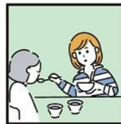
障がいや病気のある家族の身の回りの世話をしている。