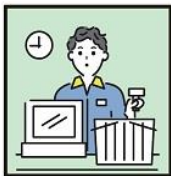
家計を支えるために労働をして、障がいや病気のある家族を助けている。