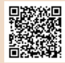
岩見沢市移住定住

TEL.0126-35-4834 (直通) FAX.0126-23-9977 Mail.kikaku@city.iwamizawa.lg.jp 〒068-8686 北海道岩見沢市鳩が丘1丁目1-1