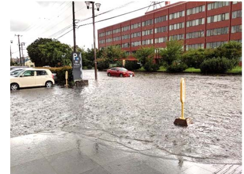
市立総合病院付近