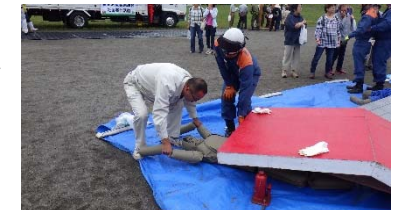
市民参加の防災訓練

また、災害時に確実に情報を伝達するため、高齢者や障がい者、社会福祉施設等へ、緊急告知FMラジオの無償貸与を実施するとともに、岩見沢市メールサービスやSNSを活用した情報発信の多重化を図ります。