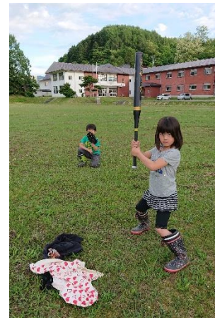
「私たちの美流渡小学校」