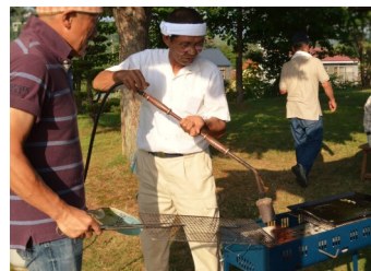
暑い中の準備、 ありがとうございました！