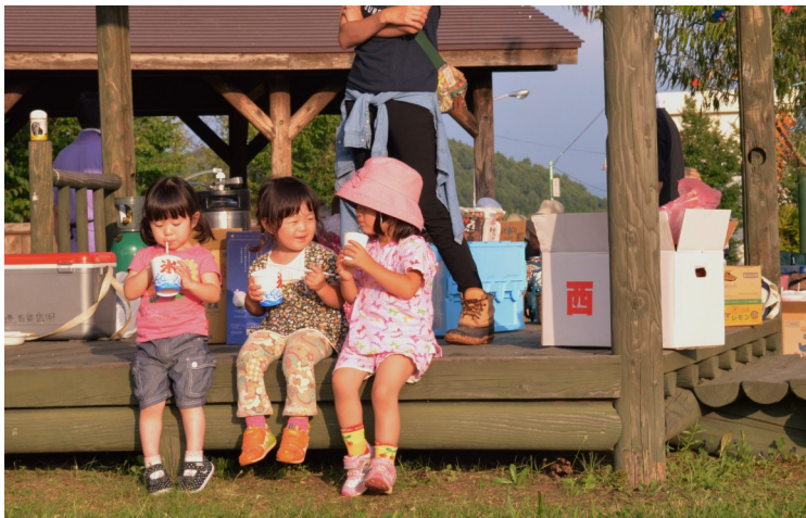
「おいしいね～」とにっこり♪

8月6日、美流渡みんなの森運動広場で開催されました。子どもも大人もみんなで一緒にバーベキューやスイカ割りを楽しみ、素敵な夏の思い出になりました♪