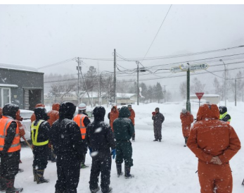
朝日町でのボランティア