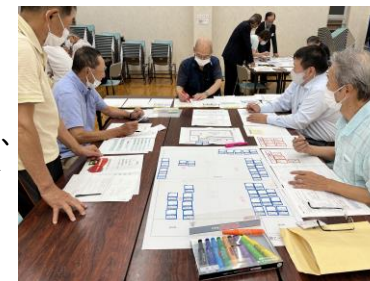
防災有資格者による研修会

町会・自治会等への出前講座や小中学校における防災チャレンジなどの防災教育を充実させ、市民の防災意識の向上を図るとともに、自主防災組織に対する補助制度や防災有資格者連絡会議の開催及び市民参加の防災訓練の実施により、地域に根付く方々による地域防災の推進を図ります。