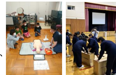
小中学校における防災教育(防災チャレンジ)

また、災害時に確実に情報を伝達するため、避難行動要支援者へ、緊急告知FMラジオの無償貸与を実施するとともに、岩見沢市メールサービスやSNSを活用した情報発信の多重化を図ります。