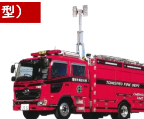
更新車両【イメージ】