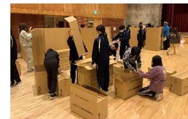
備蓄品（段ボールベッド・間仕切りパネル）を活用した出前講座

エフエムはまなすを通じ災害に関する情報発信を行うほか、出前講座や各種イベントでの緊急告知FMラジオに関する啓発を強化します。