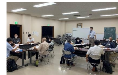
防災有資格者による研修会

防災に関する知識の普及や意識啓発を目的とした出前講座などの防災教育を充実させ、市民の防災意識の向上を図るとともに、自主防災組織に対する補助制度や防災有資格者連絡会議の開催により、地域に根づく方々による地域防災の推進を図ります。