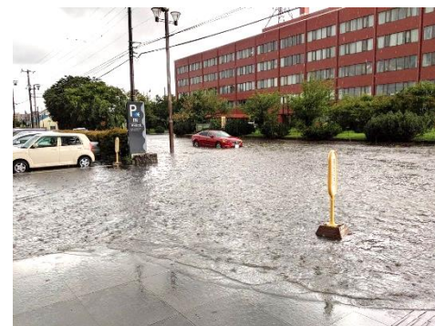
市立総合病院付近