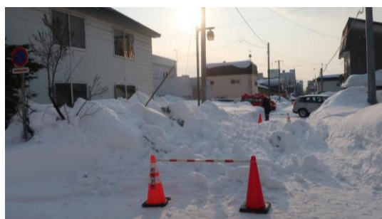
落雪による通行止めの様子