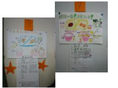
▲班ごとにキレイにまとめてくれました。