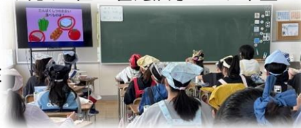
幌向小5年生 給食時間に食育動画を見ました♪