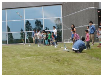
ペットボトルロケットづくり