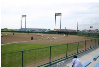
スタンドからの様子