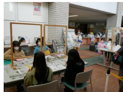
北村おはなしフェスタ