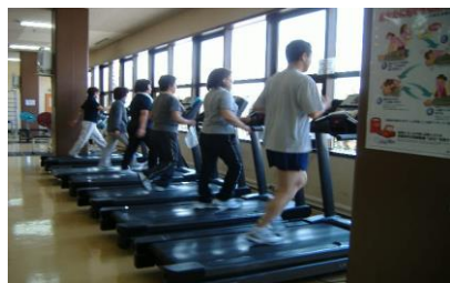
トレーニング風景