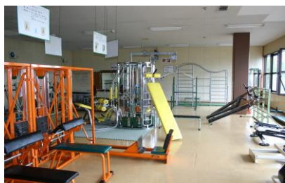
トレーニング器具