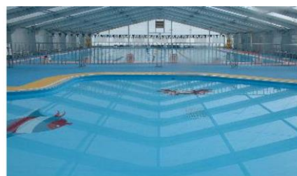
海洋センタープール