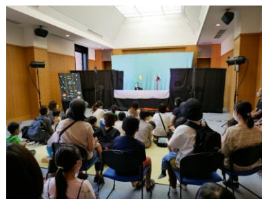
図書館フェスティバル