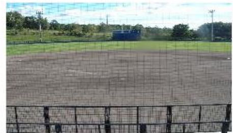
バックネット裏からの様子