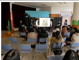
来夢まるごとクリスマス