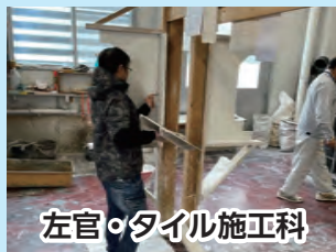
左官・タイル施工科