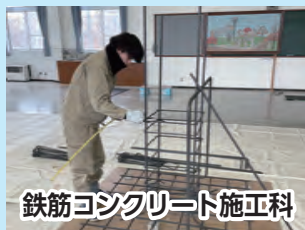
鉄筋コンクリート施工科