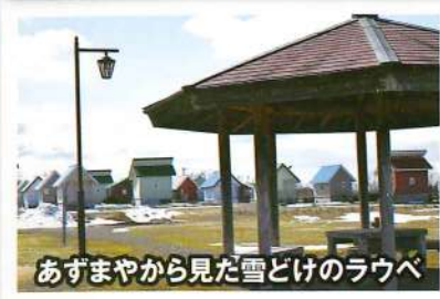
あずまやから見た雪どけのラウベ