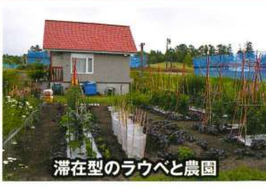
滞在型のラウベと農園