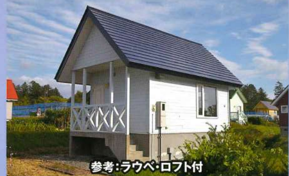
参考:ラウベ・ロフト付