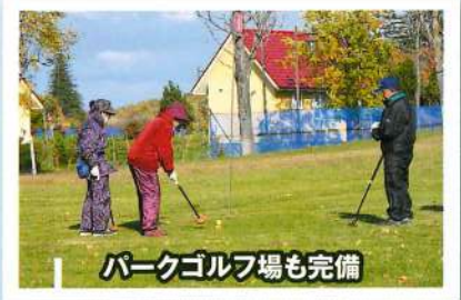
パークゴルフ場も完備