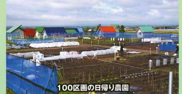
100区画の日帰り農園