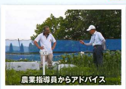
農業指導員からアドバイス