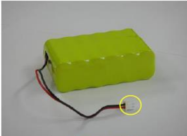
(コネクタ一部露出)