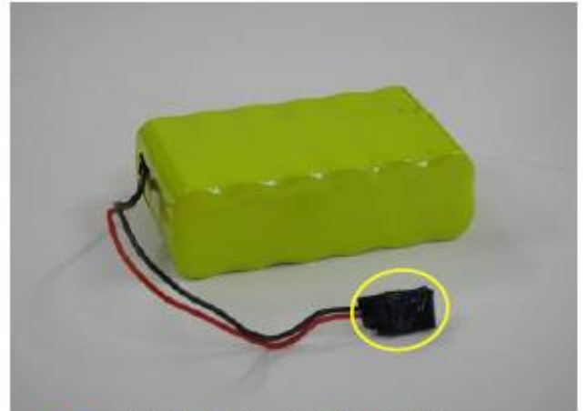
(コネクタ一部の被覆)