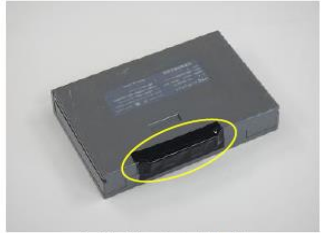
(電極端子部の被覆)