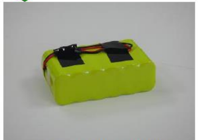
(コネクタ一部、リード線の固定)