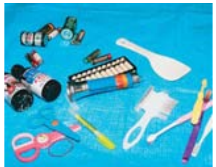
▲その他プラスチック製品やびん