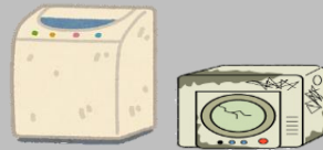
洗濯機・衣類乾燥機