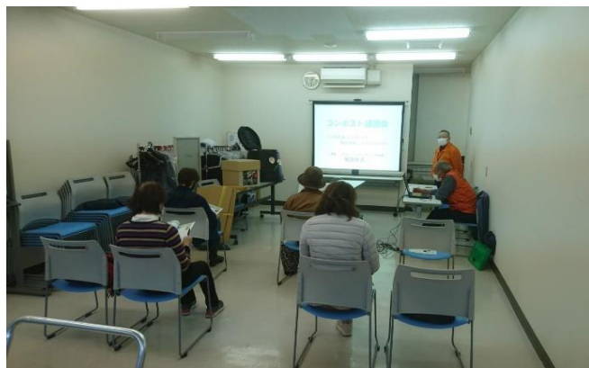
▲市民会議の委員によるコンポスト講習会