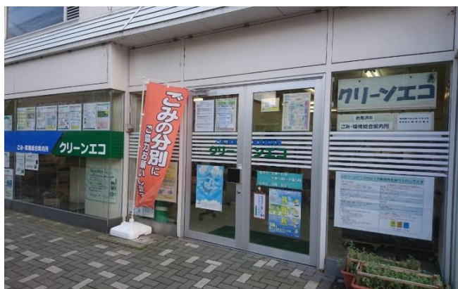
▲ごみ・環境総合案内所 クリーンエコ