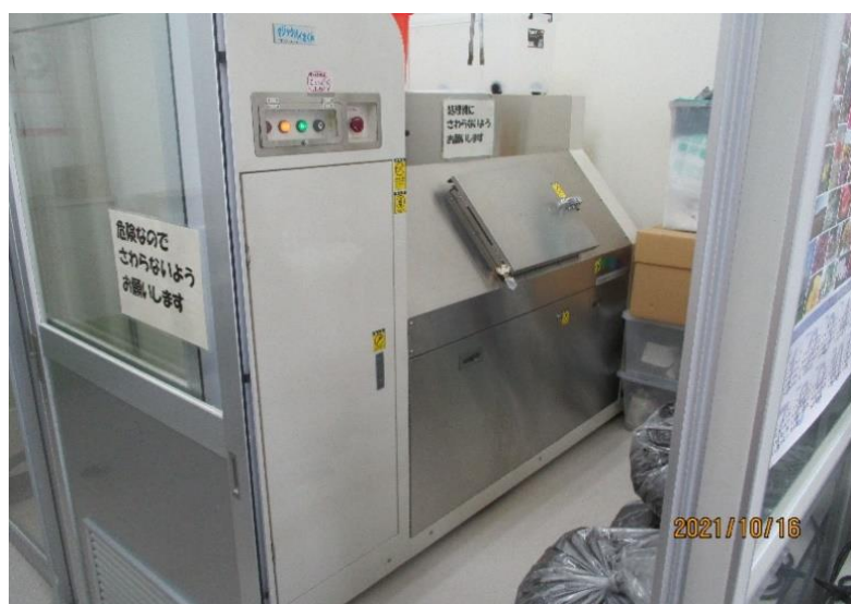
▲生ごみ処理機 マジックバイオくん

クリーンエコで受け入れた生ごみは、生ごみ処理機「マジックバイオくん」で減容化・堆肥化しています。少量でも受け入れしていますので、ご利用ください。