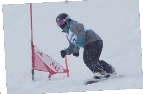
1月30日(日) 市民スキー・スノーボード大会