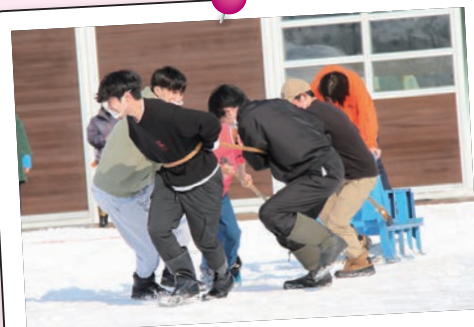
2月12日(土) IWAMIZAWA ドカ雪まつり(オンライン)