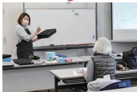
1月30日(日) 市民園芸講座 花をタネから育てよう