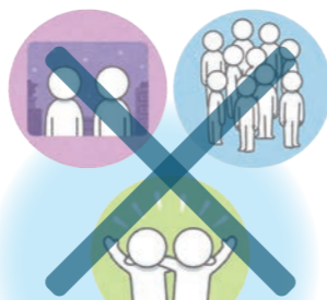
3つの密 (密閉・密集・密接) の回避