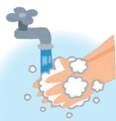
手洗い・手指の消毒