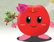
メープル小学校キャラクター メップルちゃん