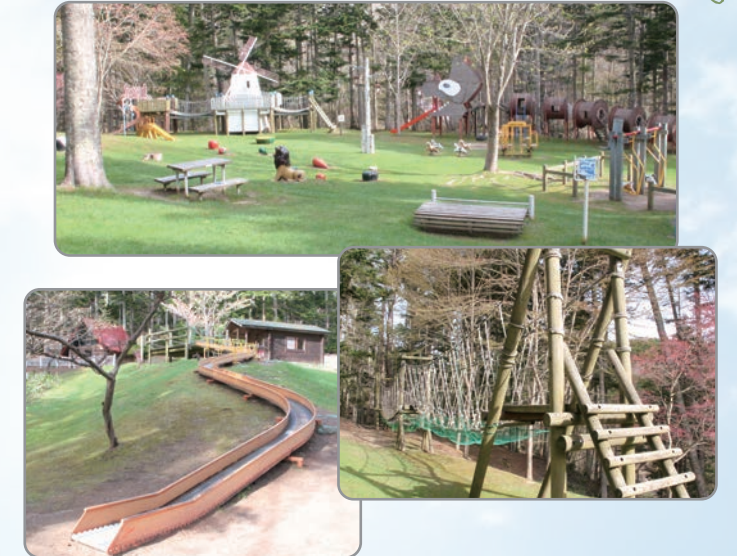
②ふるさとの森冒険ランド

たくさんの遊具に子どもたちも大満足 レトロでかわいらしい見た目とは裏腹に、スリル満点のアスレチック遊具は子どもたちの冒険心をくすぐります。