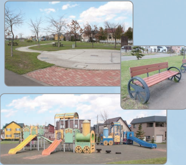
⑤室蘭本線跡地緑地

きれいな噴水と芝生で思い切り遊ぼう 住宅街から続く遊歩道沿いにある公園。噴水や浅瀬の水路で水遊びが楽しめます。鉄道の線路跡である園内には、SLをモチーフにした遊具やベンチも。