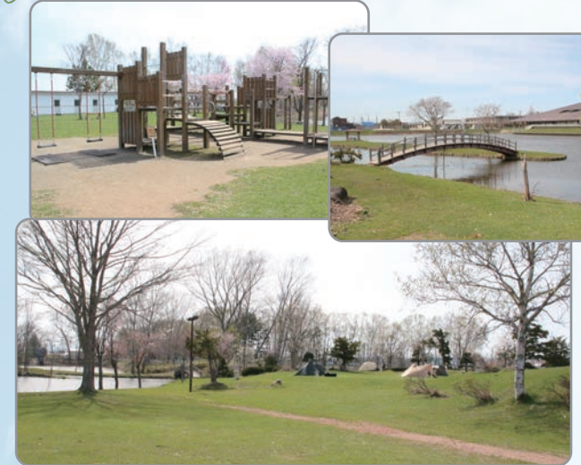
①北村中央公園ふれあい広場

温泉もコンビニも！キャンプ初心者にもおすすめ 無料でキャンプや釣りができ、有料の貸しボートも楽しめます。公園のすぐ近くに北村温泉ホテルやコンビニエンスストアがあり、キャンプをより充実させてくれます。