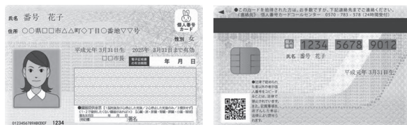
表面 本人確認書類 裏面 マイナンバー

マイナンバーカードは、写真付きの公的な身分証明書であり、本人確認書類として運転免許証やパスポートと同じように利用することができます。希望する方は、お問い合わせください。