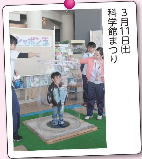
3月11日(土) 科学館まつり