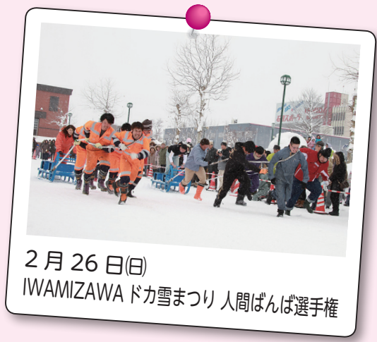
2月26日(日) IWAMIZAWA ドカ雪まつり 人間ばんば選手権