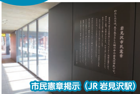
市民憲章掲示 (JR 岩見沢駅)