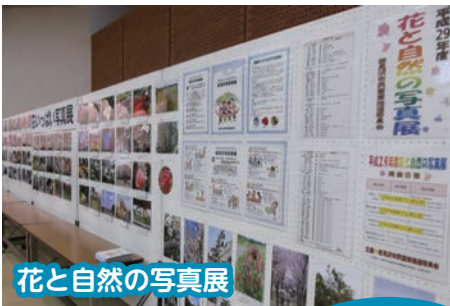
花と自然の写真展