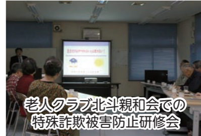
老人クラブ北斗親和会での特殊詐欺被害防止研修会

町会・自治会や老人クラブの講習会・研修会などで、特殊詐欺や交通安全などをテーマに、署員を派遣していただきます。お気軽に申し込んでいただければと思います。