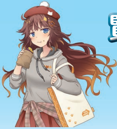
環境省 COOL CHOICE MOE 萌え キャラクター 君野イマ

良好な生活環境を保つことにつながる行動は、少しの意識で始められるものばかりです。まずは、身近な生活の中で、どのような取り組みができるのかを考えてみましょう。