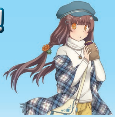
環境省 COOL CHOICE MOE 萌え キャラクター 君野ミライ