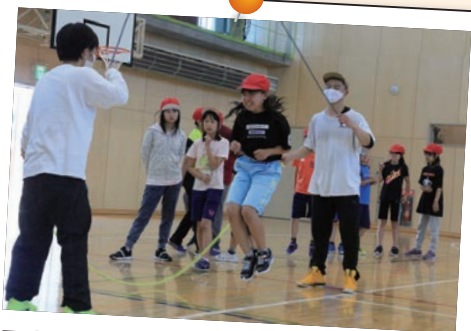
7月28日(火) なわとび教室 (志文小学校)