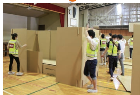
8月2日(日) 職員防災訓練