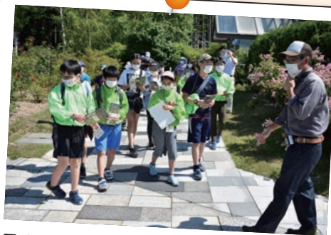
7月18日(土) いわみざわ花と緑の少年団 入団式