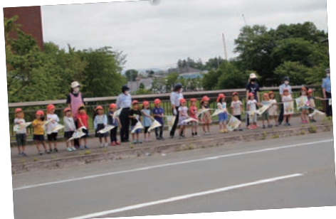
7月17日(金) 夏の交通安全運動 園児による旗の波