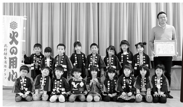
北村幼年消防クラブ