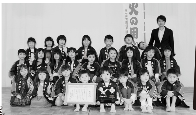
幌向保育園幼年消防クラブ

令和元年11月1日、網走市にて開催された第71回北海道消防大会において、長年、地域に密着した防火活動の功績が認められ、幌向保育園幼年消防クラブ、北村幼年消防クラブが優良消防関係団体として、北海道消防協会会長表彰を受章しました。