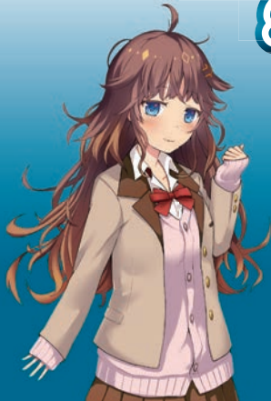
環境省 COOL CHOICE MOE 萌え キャラクター 君野イマ