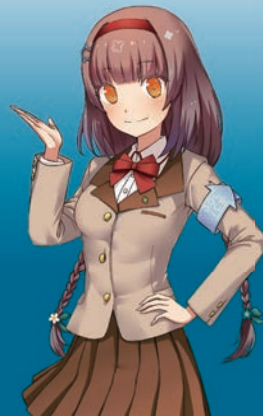
環境省 COOL CHOICE MOE 萌え キャラクター 君野ミライ