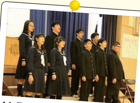
11月18日(日) 美流渡中学校閉校記念式典