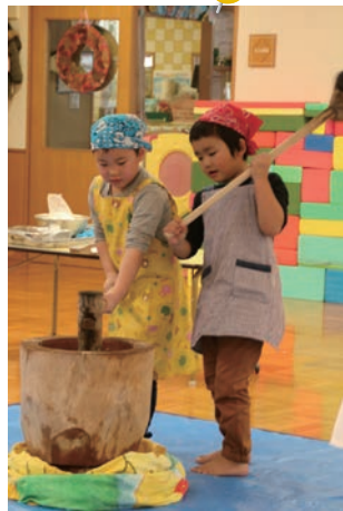
12月4日(火) ふれあい子どもセンターお餅つき会