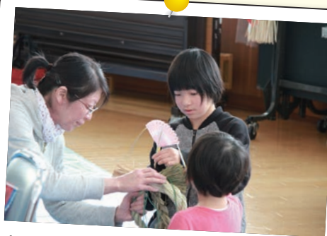
12月8日(土) しめ飾りづくり