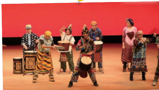
11月25日(日) アール・ブリュットショウケース 2018in 岩見沢