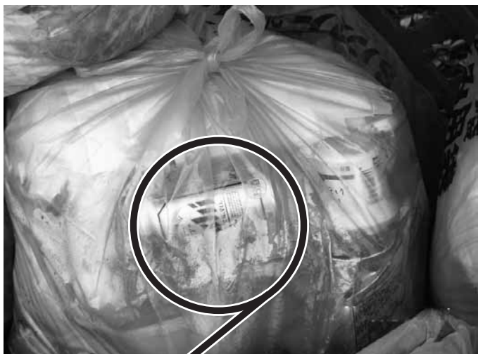
燃やせるごみの中に空き缶が混入しています

しかしながら、広報いわみざわ7月号でお知らせしたように、燃やせるごみに可燃物や資源物、危険ごみの混入があった例が現在も見受けられます。