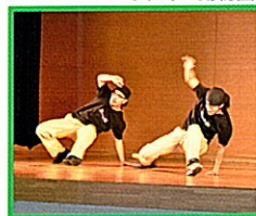
ダンス・ダンス・ダンス