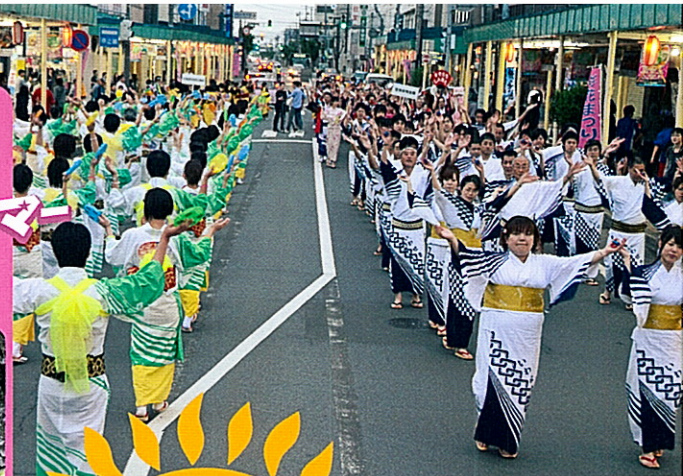
観光おどりパレード