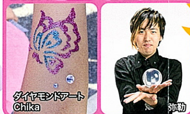
ダイヤモンドアート Chika