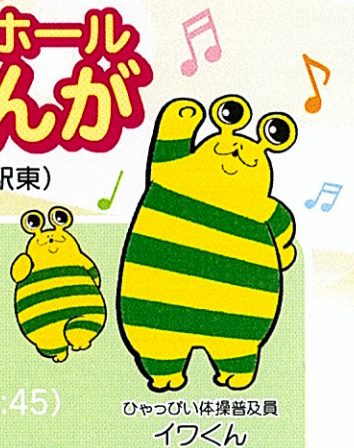
ひゃっぴい体操普及員 イフくん