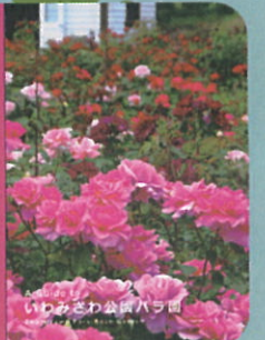
いわみざわ公園バラ園

●交通アクセス● JR岩見沢駅よこ 中央バス 岩見沢ターミナルより「万字線」で約20分 「いわみざわ公園」バス停下車 徒歩1分