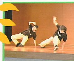
ダンス・ダンス・ダンス