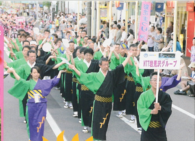
観光おどりパレード