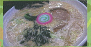
北村温泉名物 北村ラーメン

イコロの森：観葉植物、雑貨 6/27日・7/4日 湯沢園芸：山野草、高山植物 6/27日・28日 ナーセリー・ヒロ：クリスマスローズ、ハーブ 7/4日・5日 川原花木園：花木 7/4日・5日 マルダイ興産：肥料・薬剤 6/27日・28日・7/4日・5日 玉田産業：園芸用土 6/27日・28日・7/4日・5日 オアシス：園芸資材 6/27日～7/5日 花蔵ブッチパルケ：バラ、宿根草、園芸資材 6/27日～7/5日 イコロファーム：宿根草 6/27日～7/5日 ※花蔵ブッチパルケ横 そのほか、雑貨などもりだくさん♪