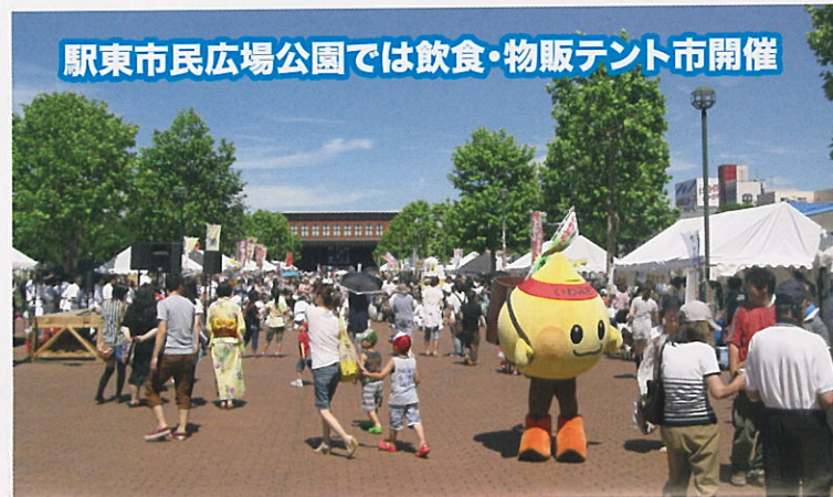
駅東市民広場公園では飲食・物販テント市開催