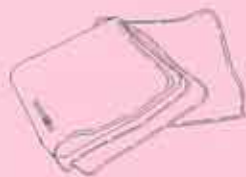
エントリー№1 大量のガーゼ

口を拭いたり、体を拭いたり するのに使います。 とにかく、大量にあって困るこ とはない！