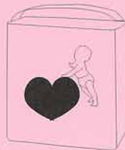
エントリー№3 おむつ

こちらは、言うまでもなく mu st item ! 厚手のシートや化粧水が含ま れているシートなど様々な種類 があるのでお財布と相談して決 めましょう。