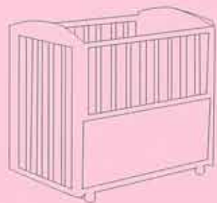
エントリー№3 ベビーベッド

子どもの動きが制限され、イ スでも滑らないので便利！ 足元の板が動かせて長期間 使える物やデザイナーがデザ インしたおしゃれなものもあ るのでお気に入りを見つけよう！