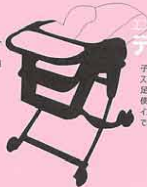
エントリー№2 テーブルチェア

空気で膨らますタイプやマット になるタイプの物もあります。 コンパクトになるタイプは便利 かも！