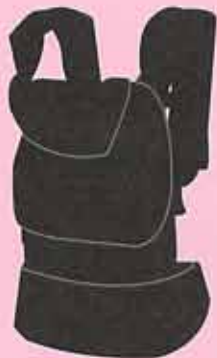
エントリー№2 抱っこ紐

口を拭いたり、体を拭いたり するのに使います。 とにかく、大量にあって困るこ とはない！