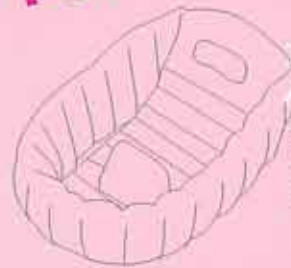
エントリー№1 ベビーバス

空気で膨らますタイプやマット になるタイプの物もあります。 コンパクトになるタイプは便利 かも！