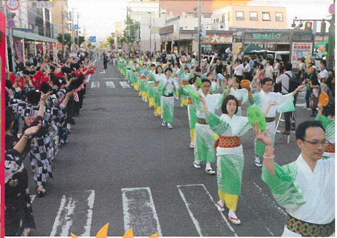
観光おどりパレード