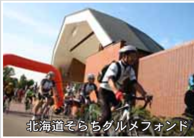
北海道そらちグルメファンド

食とサイクリングを満喫するイベントを実施し、南空知の市町と連携を図りながら、広域観光の推進を行いました。