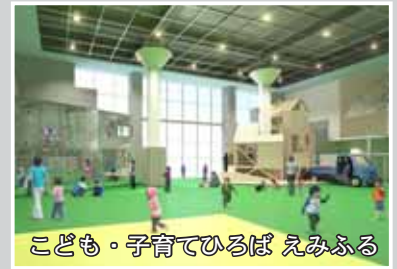
こども・子育てひろば えみふる

子どもたちが安心して学習などができる教育環境の整備を行うため、耐震補強工事を行っています。(南小、東小、幌向小)