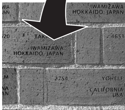
皆さんの おも の想いが込められた刻印レンガ

市は、来年春のグランドオープンを目指して、昨年6月23日にオープンしたJR岩見沢駅舎と一体となる市の施設と駐輪場、まちの南北をつなぐ自由通路の整備を進めています。