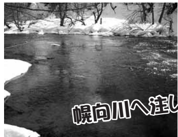
幌向川へ注いでいます