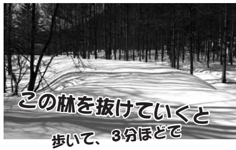
この林を抜けていくと 歩いて、3分ほどで