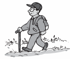
水の流れる音が 聴こえてきます