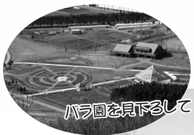
バラ園を見下ろして

バラ園、野外音楽堂から見上げると、自然の木立ての中に、頭を出しています。見晴台は、展望デッキまで車イスで上がることができる勾配で、身体の不自由な方や高齢者の方も安心して利用できます。