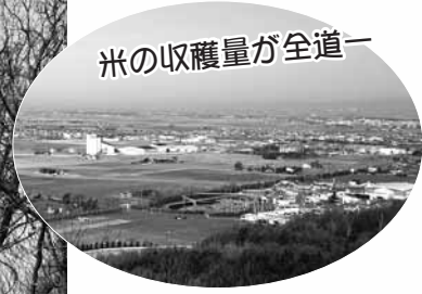
米の収穫量が全道一