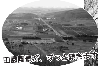
田園風景が、ずっと続きます