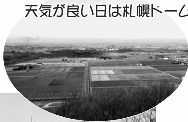
天気の良い日は札幌ドームが見えるかも