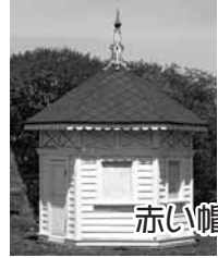
赤い帽子の着水塔が目印