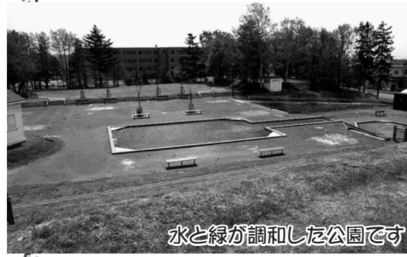
水と緑が調和した公園です