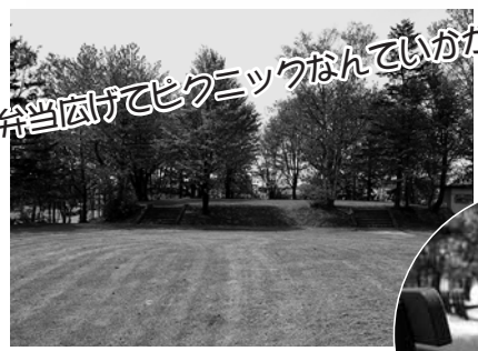
芝生の上でお弁当広げてピクニックなんていかが?