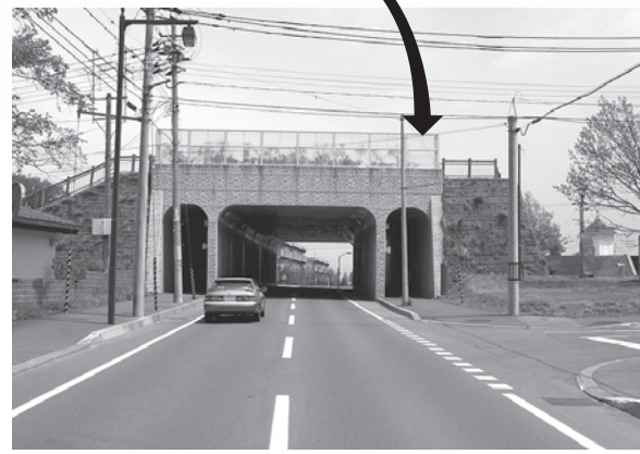
北海道中央労災病院横のトンネル