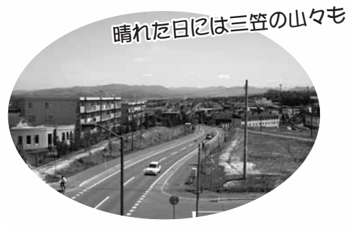
晴れた日には三笠の山々も