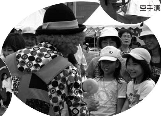
風船パフォーマンス