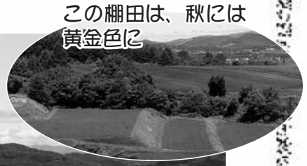
この棚田は、秋には黄金色に