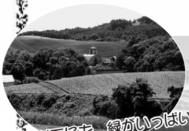
斜面にも、緑がいっぱい

ここは、坂の頂上から田園風景が一望でき、緑豊かな景色や農作物の収穫風景など、季節により様々に表情を変えて皆さんを迎えてくれるでしょう。