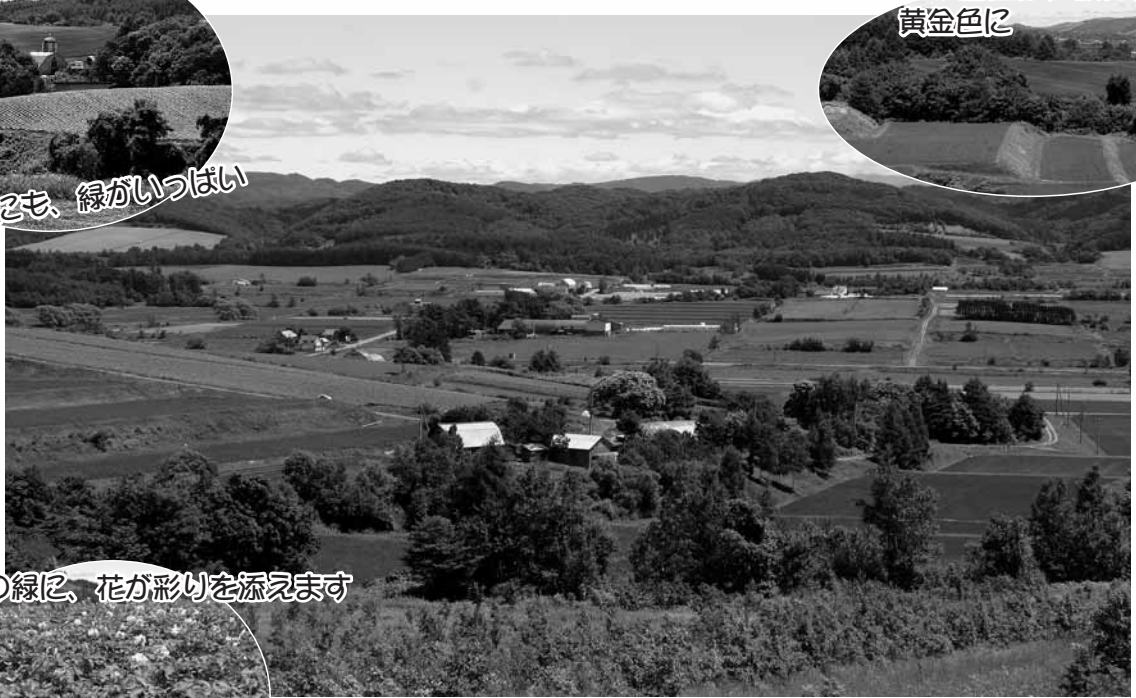
一面の緑に、花が彩りを添えます