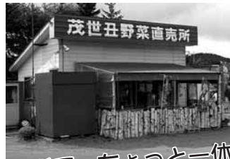
直売所で、ちょっと一休み。